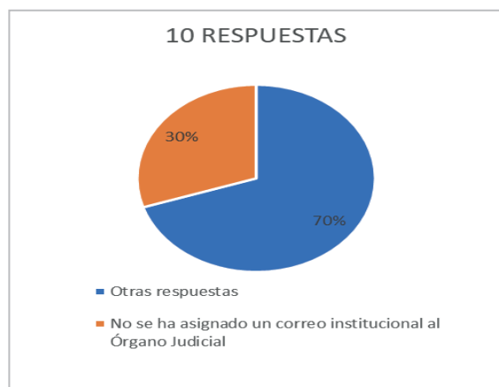
Gráfico 4. En caso de ser negativa la anterior pregunta, ¿cuál es el motivo?