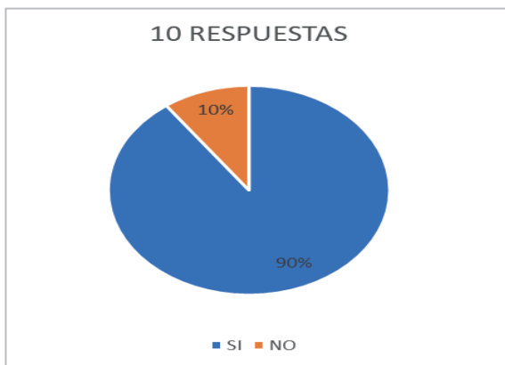
Gráfico 3. Usa el juzgado las notificaciones electrónicas autorizadas por medio del sistema Hermes

En resumen, según los gráficos 2, 3 y 4 tenemos las siguientes conclusiones: