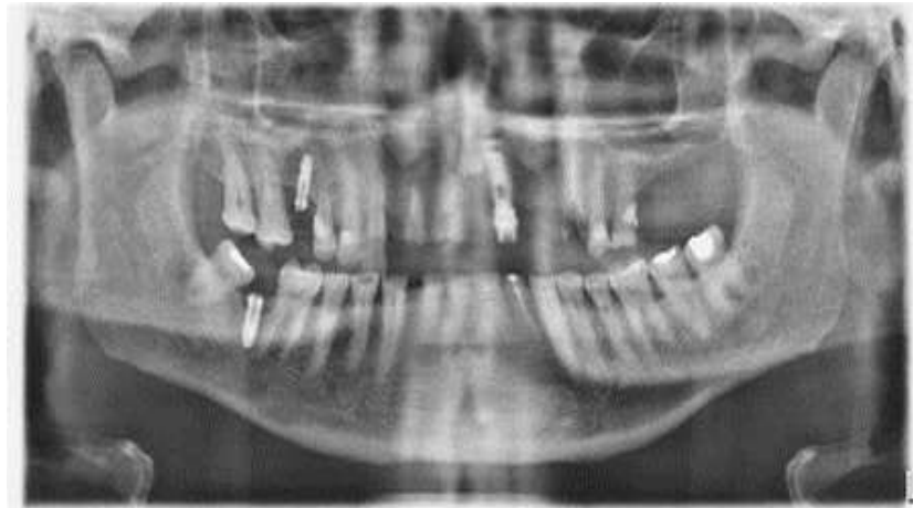
Figura 1. Imagen radiográfica de restos radiculares en piezas 11, 12, 13 y ausencia de piezas dentarias 21, 22