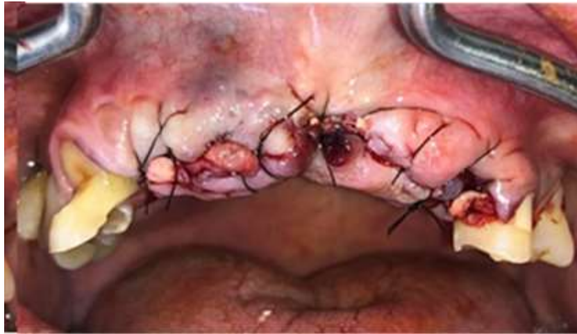
Figura 5. Proceso de cicatrización