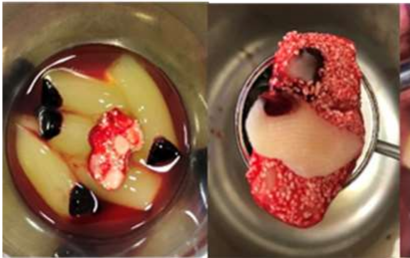
Figura 3. Preparación de fibrina rica en plasma