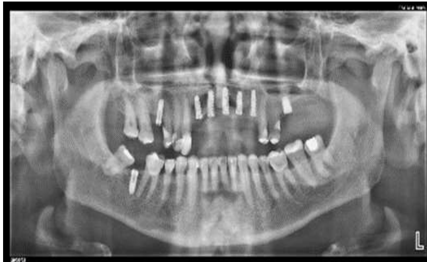
Figura N°6. Radiografía. Resultado final de la radio opacidad

Fuente: Regeneración ósea guiada y asociada a Sticky Bone en implantes.